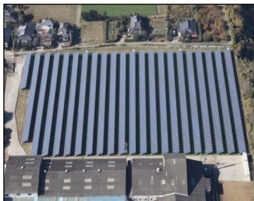
地上設置(1,000Kw)航空写真