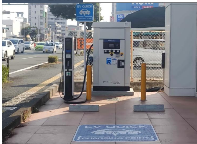
熊本トヨタ自動車株式会社様 [熊本県 熊本市]