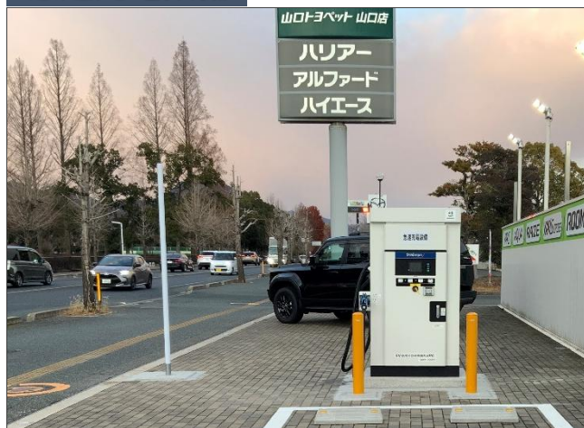
山口トヨペット株式会社様